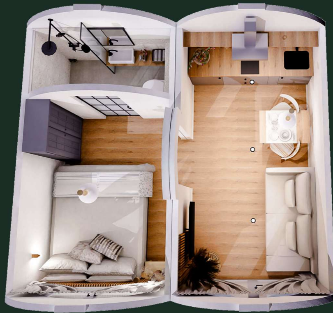
Hobbit – Cobertura verde