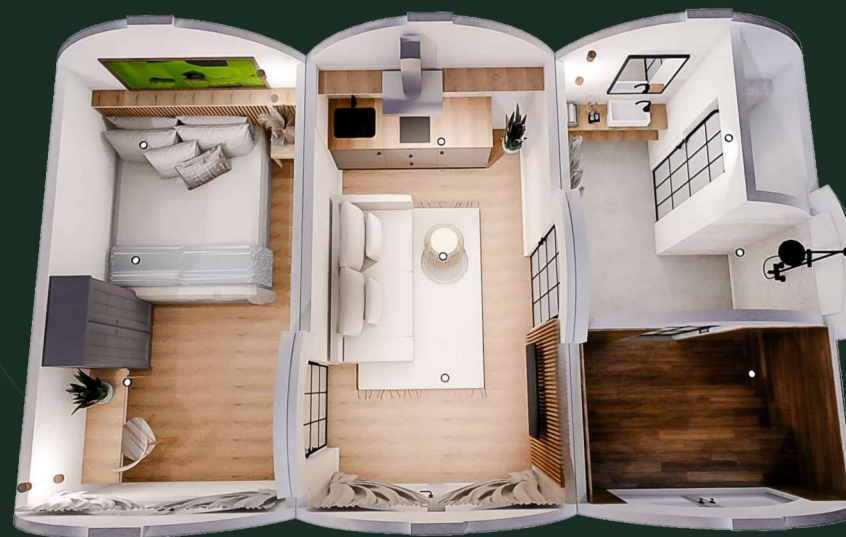
Opção B com sauna