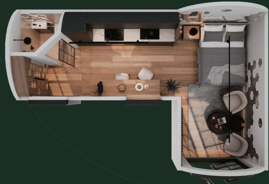
Tiny Plus – As nossas 3 coberturas